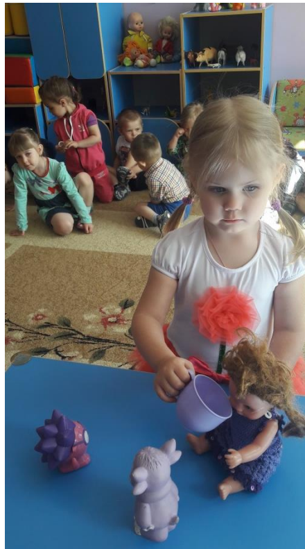
Дидактические игры на закрепление основных цветов: