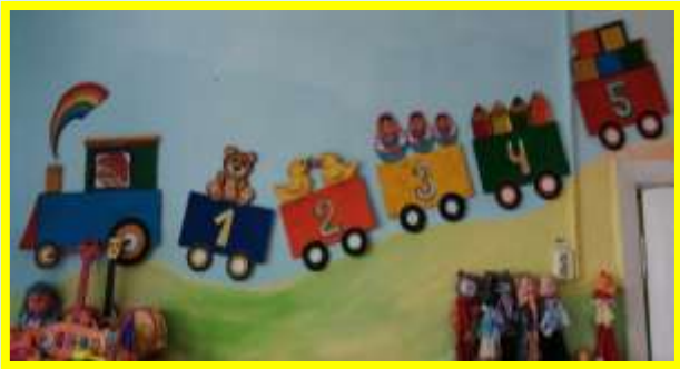
ЦЕНТР: ЗАНИМАТЕЛЬНОЙ МАТЕМАТИКИ