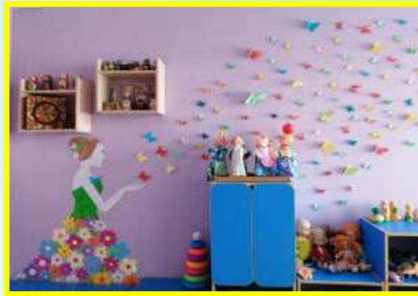
ЦЕНТР СЕНСОРНОГО РАЗВИТИЯ