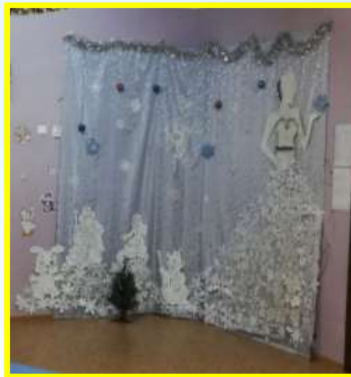
ЦЕНТР «ВРЕМЕНА ГОДА»